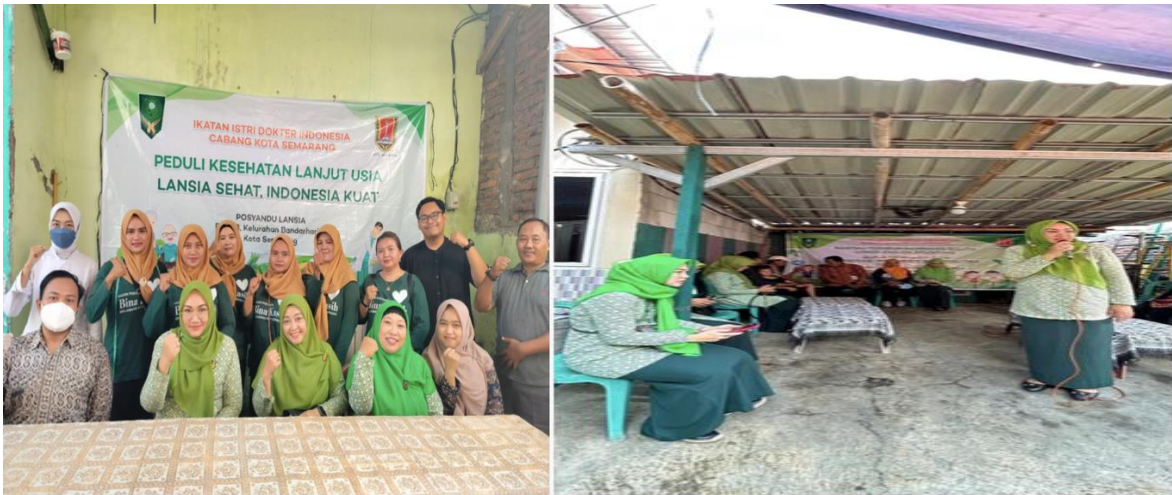
Gambar 3. Pelaksanaan pembinaan Posyandu balita dan lansia

keterbatasan jumlah kader yang terlatih di daerah-daerah terpencil. Beberapa masyarakat juga masih kurang memahami secara mendalam tentang pentingnya pemeriksaan rutin untuk lansia, yang memerlukan pendekatan yang lebih intensif. Oleh karena itu, penguatan kapasitas kader Posyandu di daerah-daerah tersebut serta penyediaan fasilitas yang memadai menjadi hal yang sangat penting untuk terus ditingkatkan. Selain itu, dukungan dari pemerintah dan masyarakat setempat untuk berpartisipasi aktif dalam memelihara keberlanjutan program Posyandu juga sangat diperlukan agar manfaat Posyandu dapat dirasakan secara optimal oleh seluruh lapisan masyarakat.