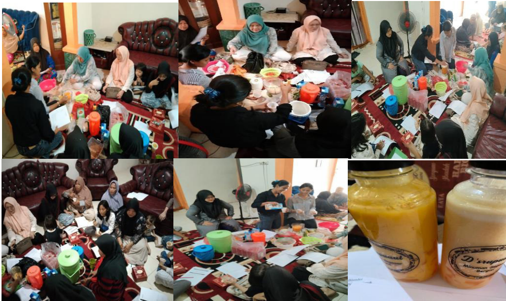
Gambar 3. Demonstrasi pembuatan minuman segar dan bergizi