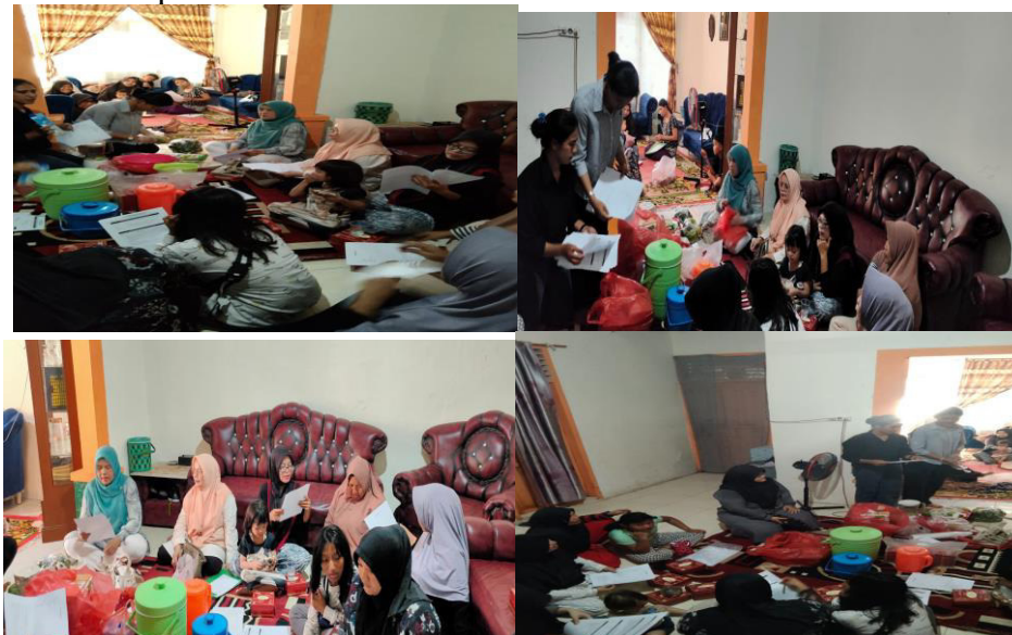
Gambar 2. Kegiatan dimulai dengan penjelasan tujuan kegiatan dan pembagian petunjuk pembuatan minuman segar

Penjelasan pembuatan minuman segar bergizi dimulai dengan menjelaskan bahan-bahan dan alat-alat yang diperlukan. Kemudian dimulai demonstrasi pembuatan minuman segarnya. Minuman yang sudah siap diberikan kepada ibu-ibu untuk dicicipi.